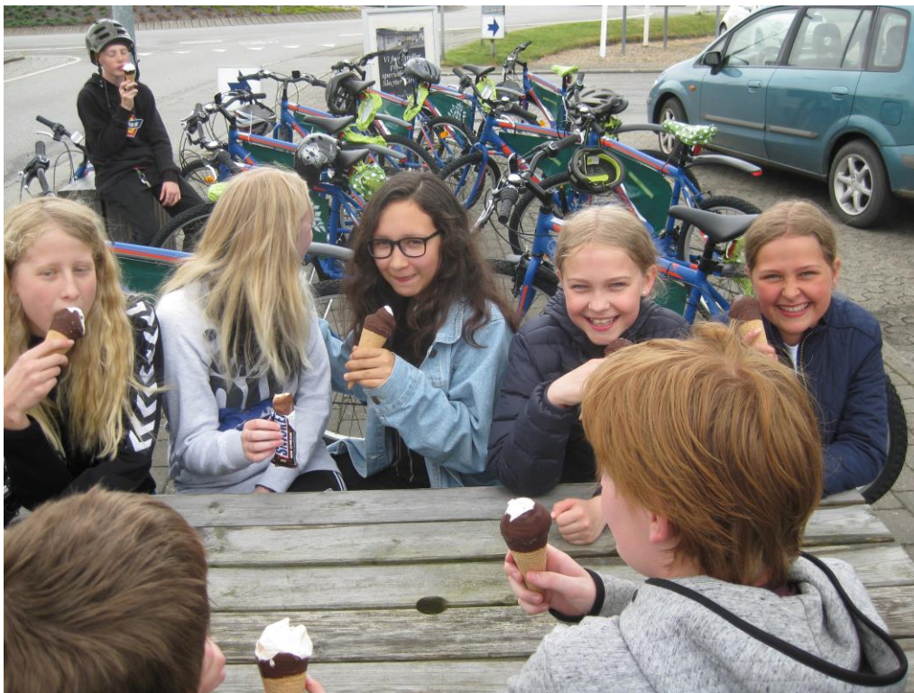
6.kl. 2017

Det betyder også noget for dit barns trivsel, at I som forældre bakker op om skolens arrangementer. Hvis I desværre er forhindret i at deltage, så sørg for at jeres barn deltager.