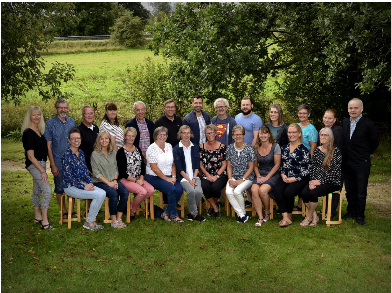
Personalet i Skarrild Karstoft Landsbycenter 2018