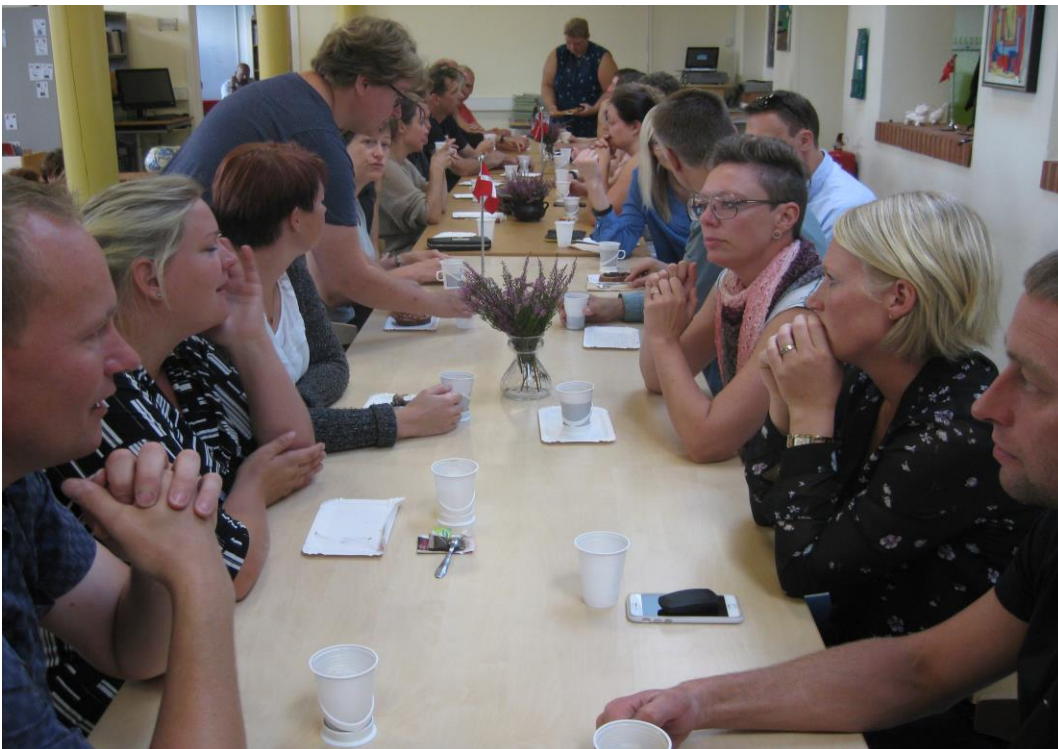
Åbent hus 2017