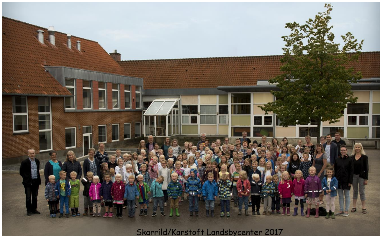
Skarrild/Karstoft Landsbycenter 2017