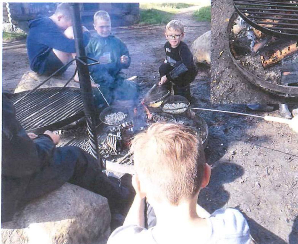
Børnene hygger med at poppe popcorn over bål.