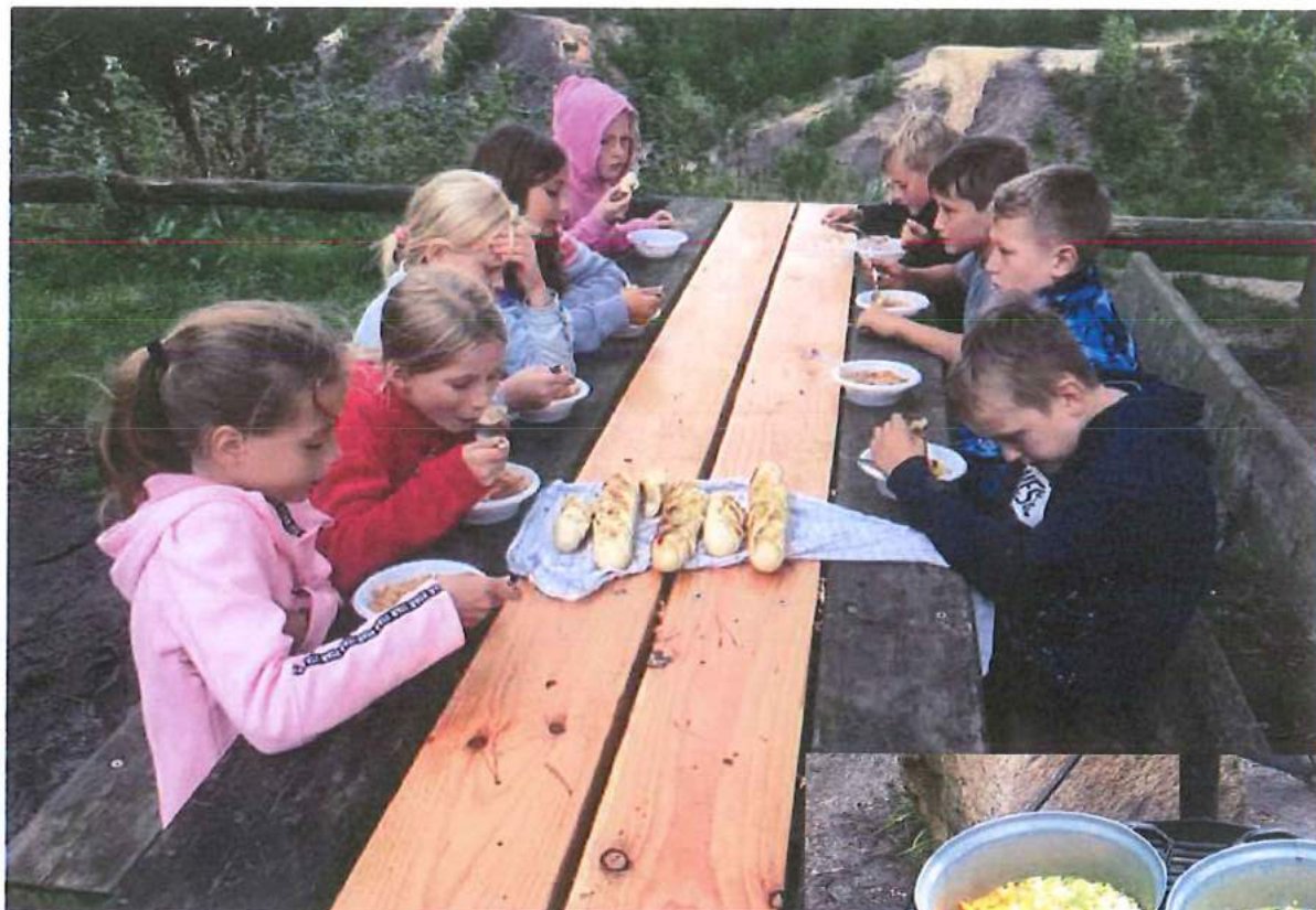
Aftensmad i den dejlige natur. Grøntsagssuppe og hvidløgslutes.

Selv om vejret ikke var helt det bedste så var humøret helt i top hos børnene. Dagen før de skulle på tur, havde de selv været med i skolekøkkenet og forberedt den mad, som vi skulle tilberede over bålet på lejrpladsen. Der skulle laves grøntsagssuppe og appetitten var stor, da vi nåede til spisetid og det til trods for, der både var spist kage og popcorn om eftermiddagen. Kagen havde børnene selv bagt om onsdagen og popcornene blev poppet over bålet.