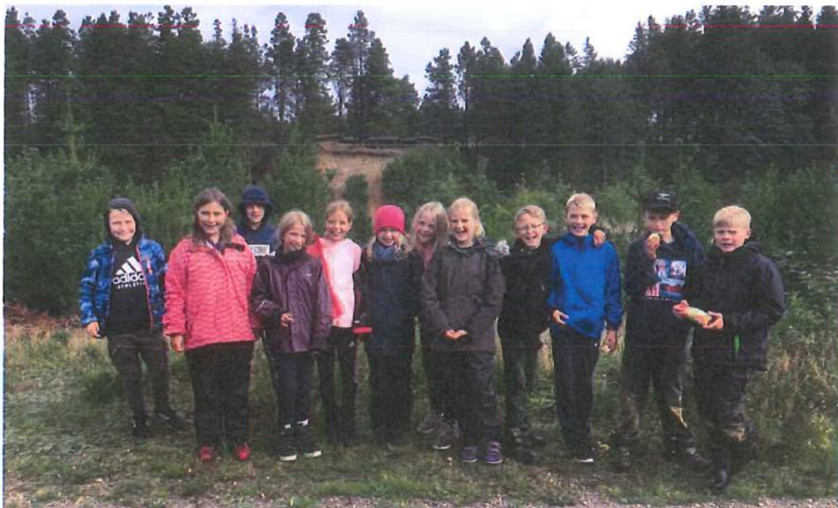
4. klasse i Momhøje

Turen startede med, at vi tog bussen fra skolen til Kibæk. Herfra gik vi med en dejlig natursti ud til Momhøje. Undervejs på turen kunne vi nyde friskplukkede brombær og nogle af drengene fik lært at "pifte" i græs.