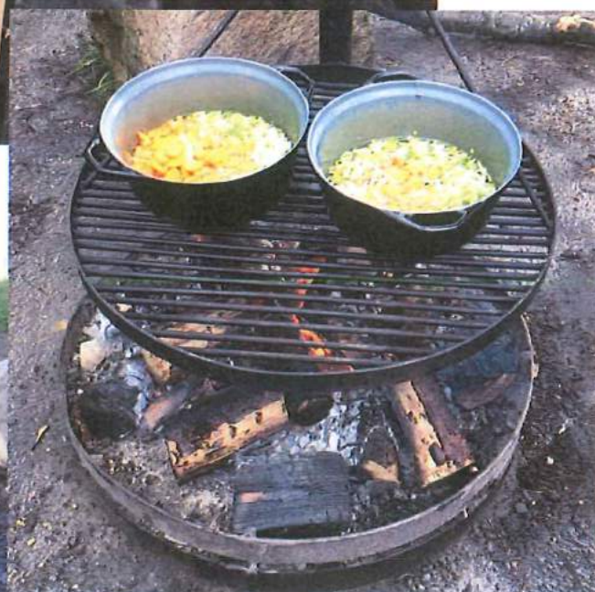
Suppe simrer 😊