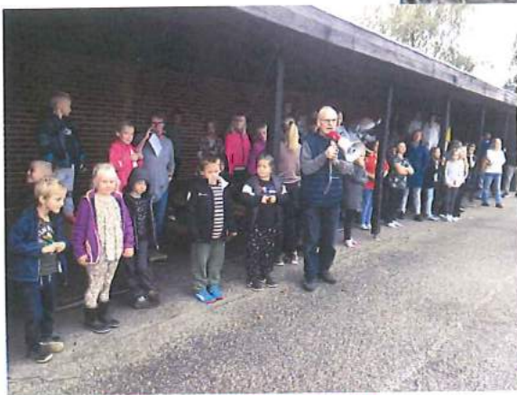
Brandøvelse på Skarrild Skole 2019

Information fra Skarrild Karstoft Landsbycenter