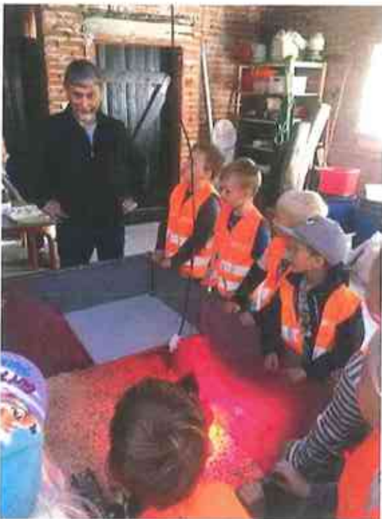
På dette billede er vi inde og se kyllinger og høre lidt om dem.

Der var rigtig mange ting, som vi kunne prøve derinde såsom malke en ko, smage honning og høre historie om bierne, smage bål mad, lave trolde af natur materialer og finde insekter. Ja og mange flere ting. Vi havde en dejlig dag derinde.