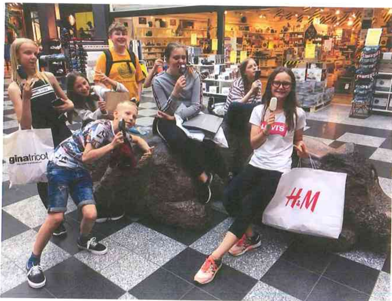
skrevet af Adriane

Herfra vil jeg sige tusind tak for en sjov, og ikke mindst hyggelig udflugt, til legepatruljen.