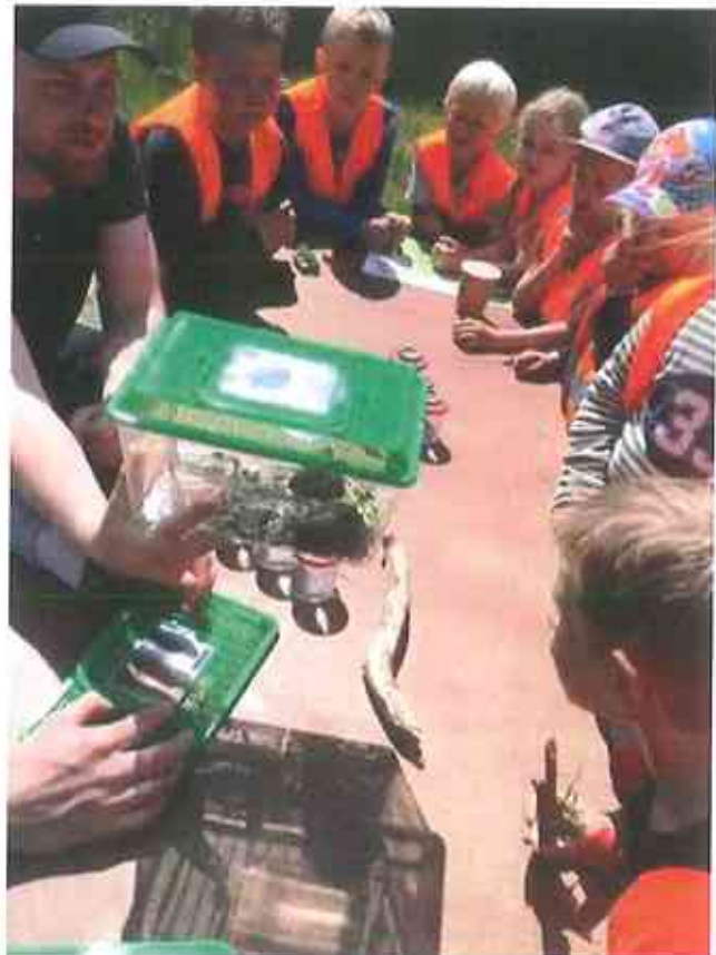
På dette billede ser vi insekter som er fundet i skoven og vi skulle også selv ud og finde nogle.